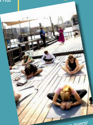
Atelier yoga 'Pour un avenir incarné' lors d'un festival à Berlin en 2023

Mardi 7 mai Le bouddhisme vietnamien en France Pascal Bourdeaux / EPHE-PSL, GSRL