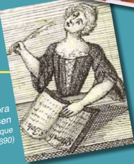
Johanna Eleonora Petersen (gravure satirique vers 1690)

Janvier et février 2024 Monastères, ordres féminins, groupes piétistes, quiétistes ou dissidents ... les femmes ont trouvé divers moyens entre 16 e et 18 e siècle pour s'exprimer à voix haute et de façon autonome dans les mondes religieux catholique et protestant. Un certain nombre de ces entrepreneuses religieuses ont fait le choix d'écrire et même de publier des autobiographies où elles témoignent de leur engagement et de leur foi mais aussi de leurs doutes, de leurs difficultés et de leurs combats. À travers ces textes peu connus, nous chercherons à voir si, au-delà des frontières politiques et confessionnelles, Thérèse d'Avila, Anna Maria Van Schurman, Antoinette Bourignon, Jeanne-Marie Guyon, Johanna Eleonora Petersen ou Kata Bethlen ont quelque chose de commun dans leur rapport à Dieu, aux Églises, aux êtres humains ... et à l'écriture de soi.