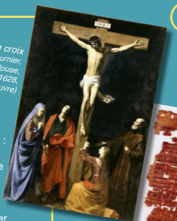
Le Christ en croix (Nicolas Tournier, Toulouse, 1628, Musée du Louvre)