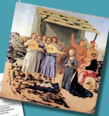
Nativité (Piero della Francesca, Florence, 1460-1475, National Gallery, Londres)