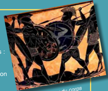
Bataille autour du corps d'un héros mort, probablement Patrocle (Cratère de Pharsale, vers -530, Musée archéologique d'Athènes)

Janvier 2024 Guerre et religion sont deux registres d'action souvent associés dans l'histoire des peuples et des civilisations : outre les guerres de religion directement motivées par des conflits sur l'interprétation de la vérité religieuse, les religions contribuent parfois à donner une justification religieuse aux guerres entre peuples sous la forme de la guerre sainte, ou encore constituer un marqueur dans des conflits de type identitaire à l'échelle nationale ou subnationale. Inversement, des pacifismes ou des refus de porter les armes se revendiquent d'une vision religieuse. Enfin, les religions sont susceptibles de proposer des idéaux et des moyens pour résoudre des conflits. Ce cycle sur deux journées se demandera d'abord s'il existe des guerres de religion puis présentera quelques cas empruntés tant aux religions monothéistes qu'aux polythéismes du monde méditerranéen ou de la Mésopotamie précoloniale.