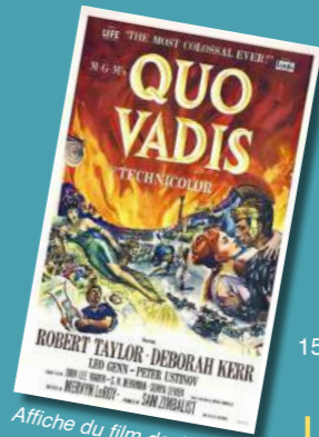
Affiche du film de 1951.

11h30-13h : Les conquêtes de l'islam premier : une affaire de Jihād ? Jamal Ahabab / IREL, EPHE-PSL 14h-15h30 : Guerre et sacrifice chez les Aztèques Sylvie Peperstraete / ULB, EPHE-PSL, GSRL 15h30-17h : Dieux, héros et guerre en Grèce antique François de Polignac / EPHE-PSL, ANHIMA