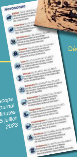
Horoscope du journal 20 Minutes le 25 juillet 2023

Décembre 2023 Le cycle abordera cette année trois grands moments de la Nativité à la Passion afin de mettre en lumière la vision qu'en ont donné les peintres à travers les siècles. L'évolution de ces représentations traduit les différentes interprétations de ces épisodes et la manière dont ils s'inscrivent dans l'imaginaire visuel jusqu'à l'époque contemporaine.