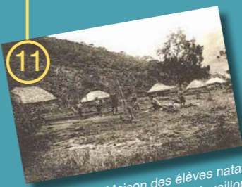
Maison des élèves natas (catéchistes) à Houailou, Nouvelle Calédonie

Lundis 29 avril et 6 mai Filmer l'islam d'hier et de demain Jamal Ahabab / IREL, EPHE-PSL